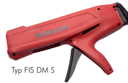
Typ FIS DM S